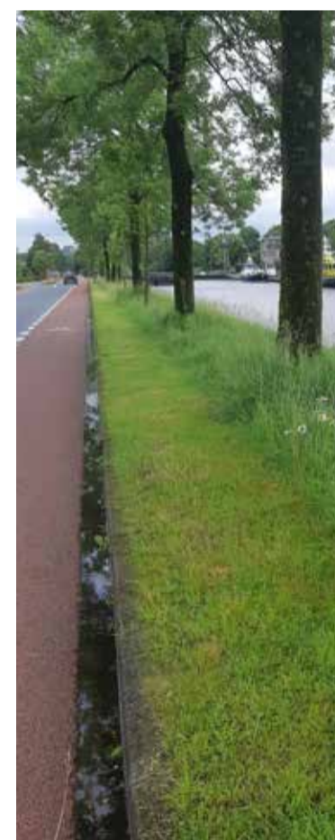
Berm maaien met bloemen. Zie ook het artikel 'De natuur kan niet wachten' op pagina 5 en 6.