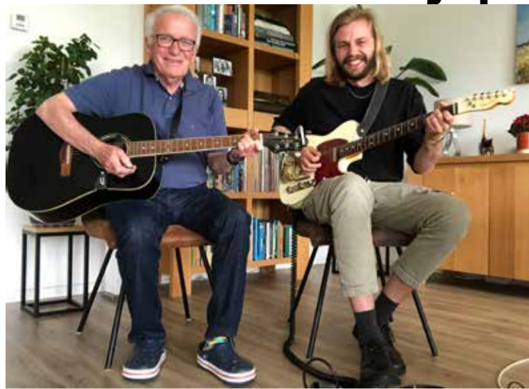
De Bojo's tijdens een repetitie.

Een belangrijk middel is deze Wijkkrant. Die verschijnt viermaal per jaar en veel mensen lezen hem. Dankzij de advertentie-opbrengsten bedruipt de Wijkkrant zich voor het grootste deel zelf. Ongeveer 20% van ons budget dragen we bij om de Wijkkrant in de lucht te houden. De hanging baskets fleuren de wijk zeker zes maanden per jaar op en zijn belangrijk; die gebruiken ongeveer 65% van ons budget. En dan hebben we nog de wijkbudgetten voor initiatieven van bewoners: ongeveer 60%. Tenslotte de vergaderkosten en de vaste kosten zoals abonnementen (internet!), ongeveer 10%. De oplettende lezer zal denken dat deze cijfers niet kloppen, want het is opgeteld totaal meer dan 100%. Dat klopt. In de afgelopen jaren