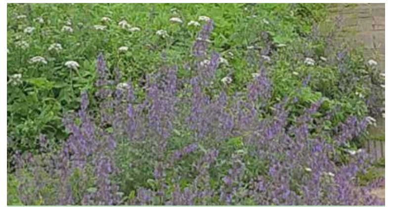
Een kleurrijk plantvak.