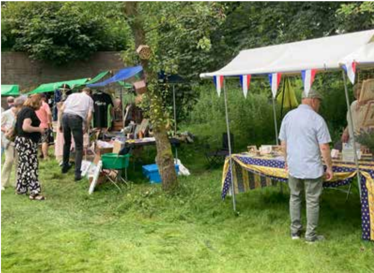
Gezellige kraampjes op Vive La France Place du Tertre.