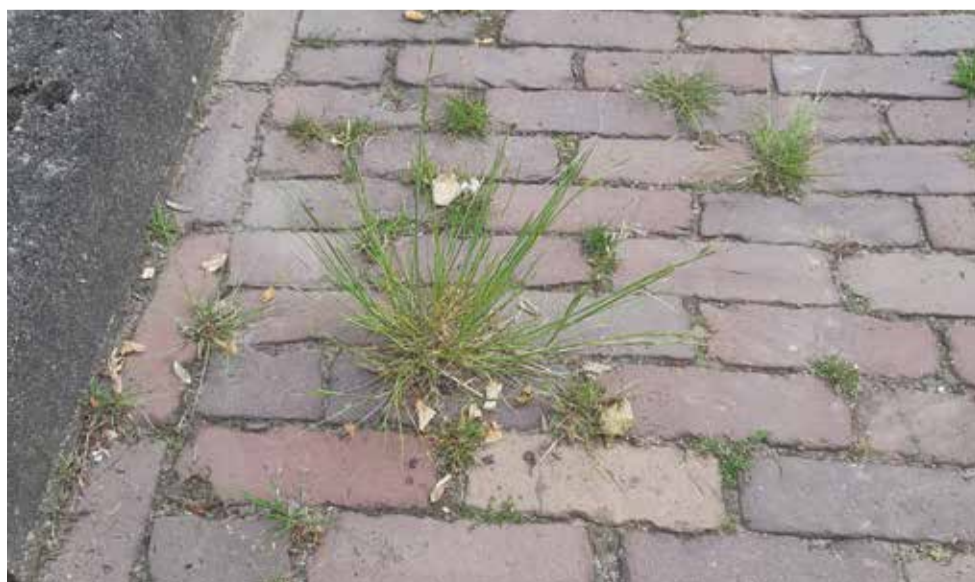
Gras in de straat.