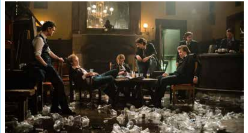
Still uit 'Niemand in de stad'.