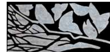
Een van de vele mooie stenen.

Het winnende idee was geïnspireerd op het programma van eisen dat de gemeente had meegegeven. Het ging niet alleen om samenwerking en ontmoeting, maar ook om de cultuurhistorische waarde van de plek Kerkveld. De tastbare en aansprekende geschiedkundige objecten waren vooral bekend