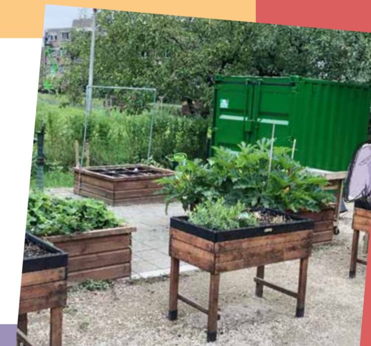
Vrienden van Park Kokkebogaard en De Grootte Hond werken nauw samen.

De vrijwilligers kunnen nu zonder zorgen hun gereedschap veilig en hufterproof opbergen. Door de groene kleur én de klimplanten die er straks tegenaan groeien is-ie onopvallend onderdeel van het park. Loon- en Verhuurbedrijf Frank van Rooijen heeft de container geplaatst. De Park-vrienden danken iedereen die heeft bijgedragen aan het realiseren van dit project.